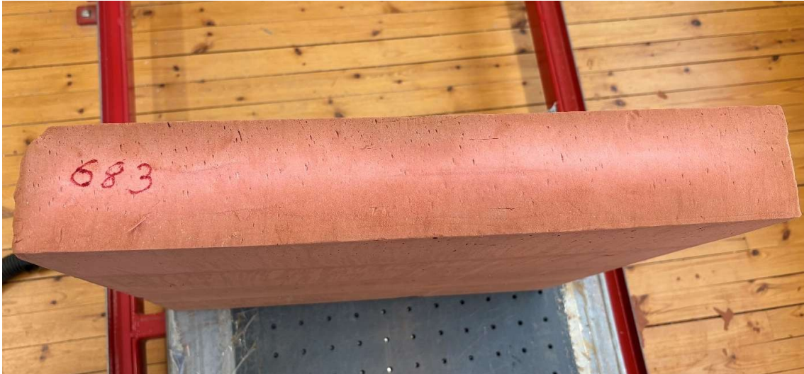
Bilde 4.1 Prøve 683 klar for klar for prøving av termisk konduktivitet etter justering av tykkelse.